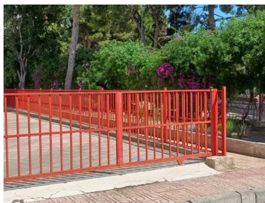
Puerta corredera (entrada para formar las filas del 2º ciclo de Infantil y 1º y 2º de Primaria).