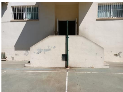
Escalera de las filas de salida de 4 y 5 años.