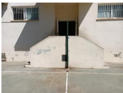
Escalera de las filas de salida de 4 y 5 años.