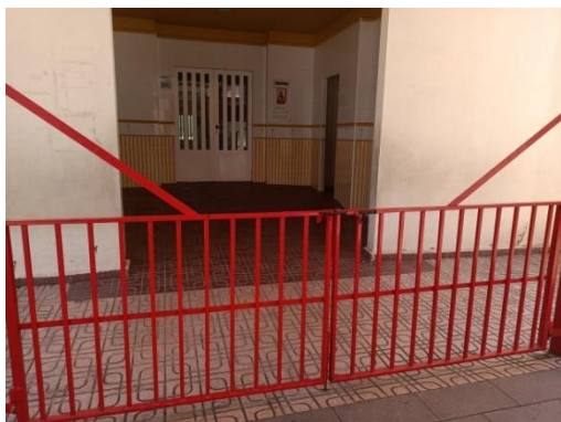
Puerta roja del patio de Infantil (acceso del alumnado de 1 y 2 años).