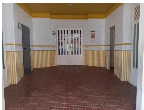
Puerta de la entrada de Infantil Salida del curso de 3 años